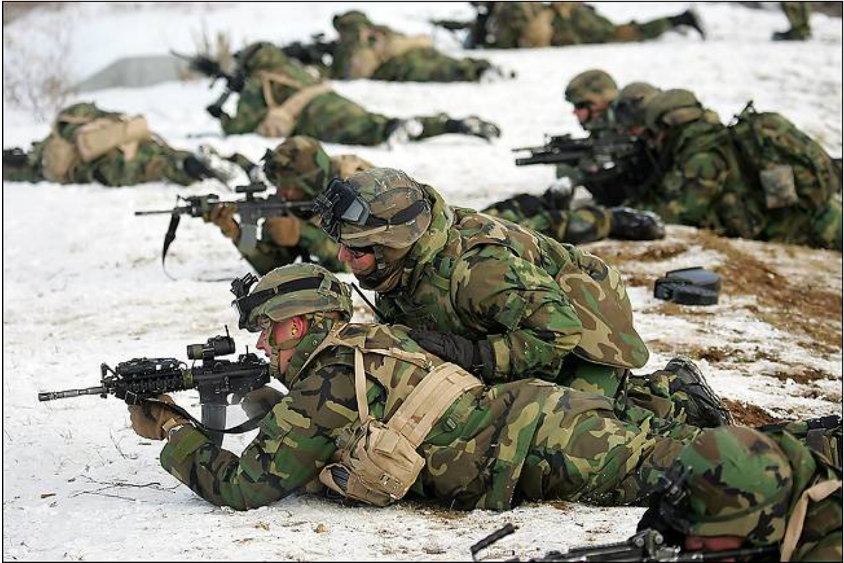
soldati della 10th in addestramento