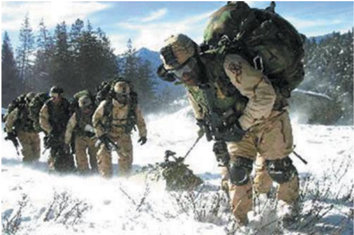
la 10th in addestramento