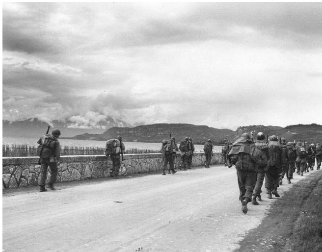
1945 - Campagna d'Italia. La 10th nei pressi del Lago di Garda