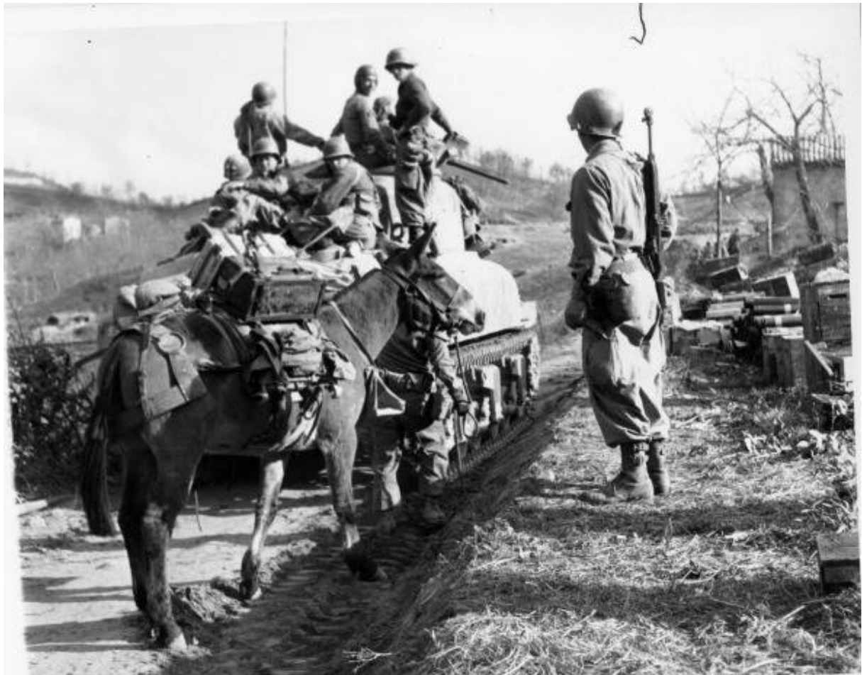
1945 - Campagna d'Italia. La 10th Mountain Division sulla Linea Gustav (Linea Gotica). Avete notato? Anche loro usavano i muli come i nostri Alpini dalla penna nera!!!!