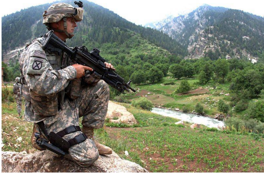
la 10th in Afghanistan