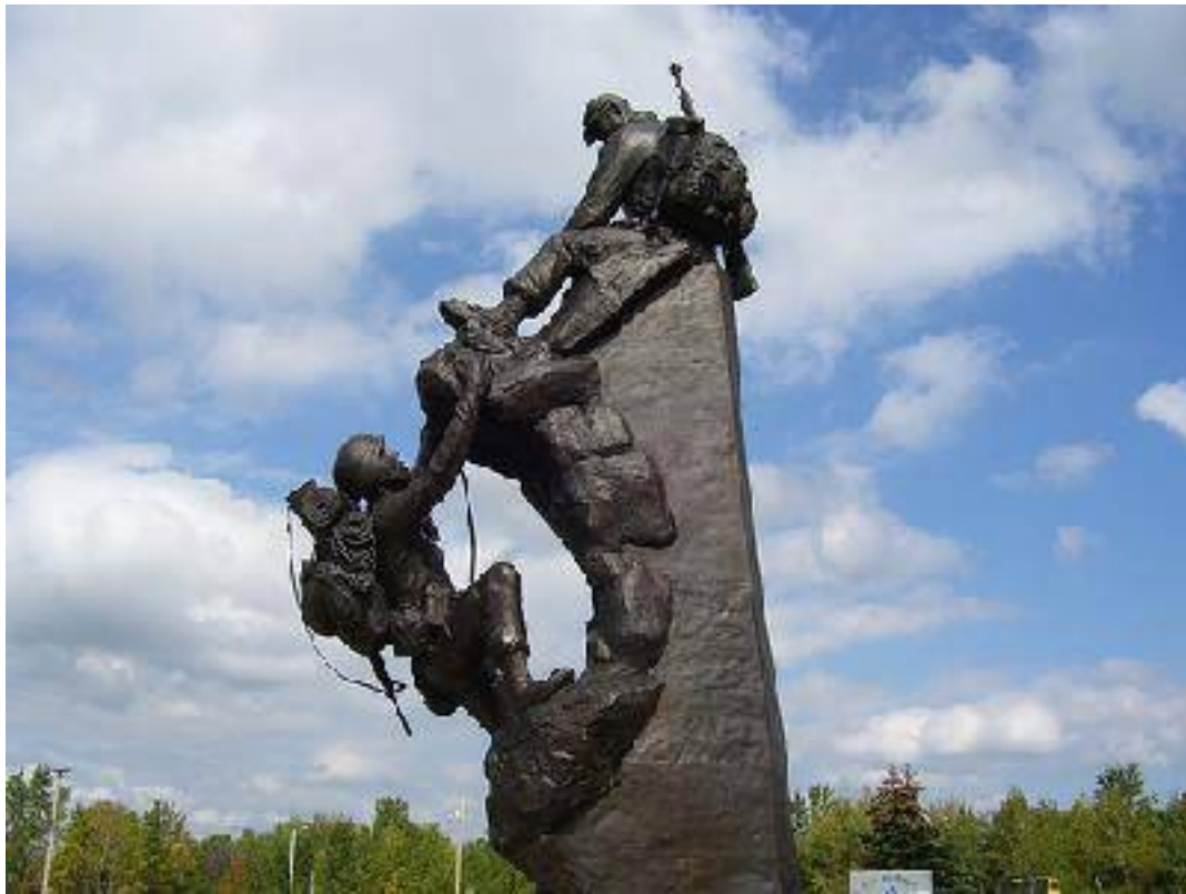
Il monumento dedicato alla 10th Mountain Division all'interno di Fort Drum